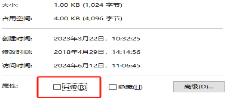
确保上图“只读”未勾选

步骤二：在二次打包时，请确保用户使用的 Code 文件属性中的 只读 选项未勾选，以免再次出现下载异常现象。